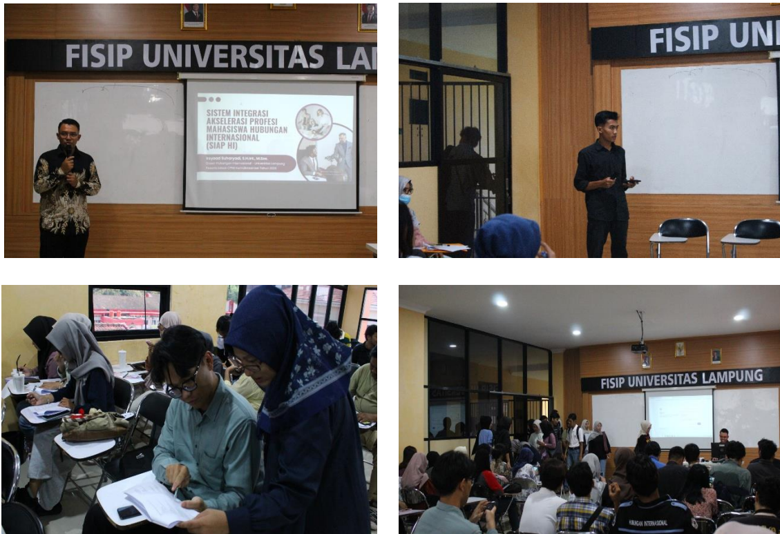
Gambar 1. Pelaksanaan Kegiatan Pengabdian SIAP HI

Internasional angkatan 2022 dan 2023 sebagai sasaran utama. Pemilihan subjek didasarkan pada pertimbangan bahwa mahasiswa merupakan kelompok strategis yang sedang berada pada fase transisi menuju dunia kerja dan membutuhkan penguatan kesiapan karier sejak dini.