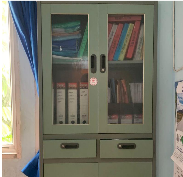
Gambar 2: Glass Door Cabinet di Ruang Sub Bagian Umum Kepegawaian

Kemudian terkait keamanan informasi arsip, Kantor Kecamatan Tanjung Lubuk telah menerapkan aturan khusus dalam hal hak akses dokumen kepegawaian karena mengingat sifat data dalam setiap arsip yang disimpan tersebut adalah data yang sensitif. Hal ini dijelaskan oleh Ibu Devi bahwa lemari arsip dalam ruang Sub Bagian Umum Kepegawaian ini tidak boleh dibuka oleh sembarangan orang. Kemudian Ibu Devi menjelaskan lebih lanjut bahwa izin untuk membuka glass door cabinet ini disesuaikan dengan tingkat kerahasiaannya, yang mana hanya pegawai yang ada pada Sub Bagian Umum dan Kepegawaian tersebutlah yang berwenang dan diperbolehkan untuk membuka dan mengaksesnya. Walaupun keamanan tersebut sudah sesuai, namun keterbatasan ruang dan infrastruktur untuk menyimpan arsip ini akan menjadi hambatan dalam pemeliharaan jangka waktu yang akan datang karena dalam jangka panjang jika arsip tersebut tidak memiliki ruang yang berbeda dengan ruang kerja pegawai, maka akan dapat meningkatkan risiko kerusakan fisik arsip hingga dapat menurunkan kualitas informasi di dalamnya (Adelia & Putra, 2024; Kurniawan & Putra, 2025).