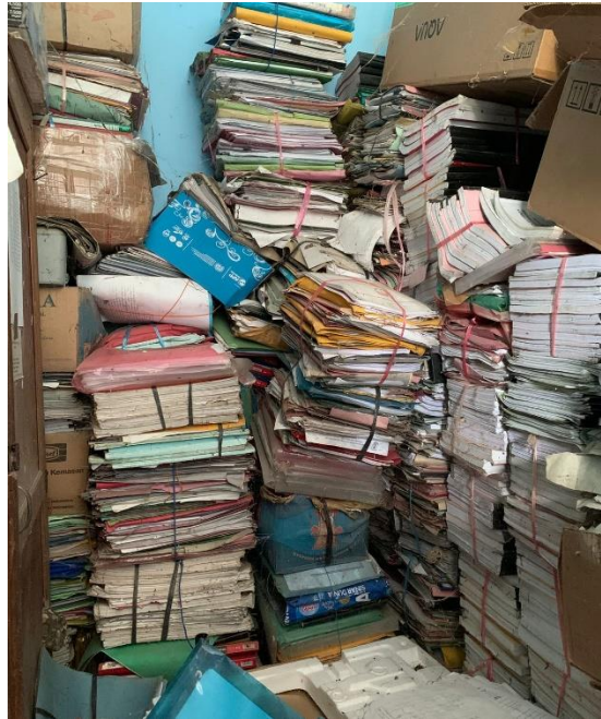
Gambar 3: Tumpukan Berkas Lama yang Melebihi Masa Retensi di Gudang